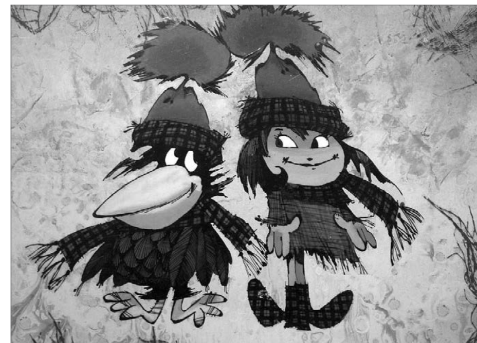
Malá čarodějnice (Zdeněk Smetana)

Třeboň nabízí i široké možnosti sportovního využití. Plavecké bazény najdete v Lázních Aurora i Bertiných lázních, určitě je třeba dopředu se objednat. Kontakty najdete na: www.aurora.cz , www.bera.cz . Bowling se hraje v hotelu Zlatá hvězda nebo v Lázních Berta, minigolf je možné zkusit v hotelu Bohemia Regent ( www.bohemia-regent.cz ), v Třeboni najdete i horolezeckou stěnu (Internát SOU oděvní).