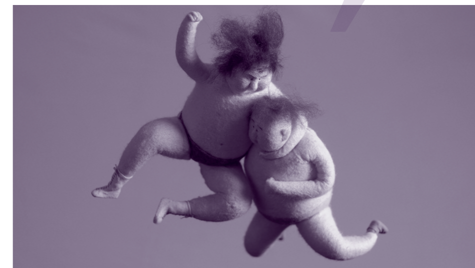
Výběr reklam z Annecy

A další z programů, který návštěvníci Anifilmu v minulých letech nepoznali, je Street animace. Ať už si z programu vyberete cokoliv, užijte si to! Děti můžete mezitím nechat si hrát v dětském koutku Rosy a Dary v prvním patře budovy Staré radnice. Otevřen je každý den festivalu od 9.30 do 18.00.