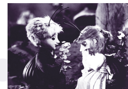
Broučci (režie Vlasta Pospíšilová)

Kromě toho, že vám děti pohlídáme každý festivalový den od 9.30 do 18.00 v dětském koutku Rosy a Dary v budově Staré radnice, můžete se s nimi vypravit i na projekce. Programy pro nejmenší promítáme především v sále České televize (kulturní centrum Roháč). A protože Večerníček letos slaví 50 let, je část projekcí zaměřena na výběry tohoto klasického formátu. Dnes například bloky nazvané Staré nej... a Černobílá je krásná . Dále se děti mohou podívat na výběr ze seriálů o Broučcích od režisérky Vlasty Pospíšilové nebo na napínavý „biják“ Jak vycvičit draka 2 .