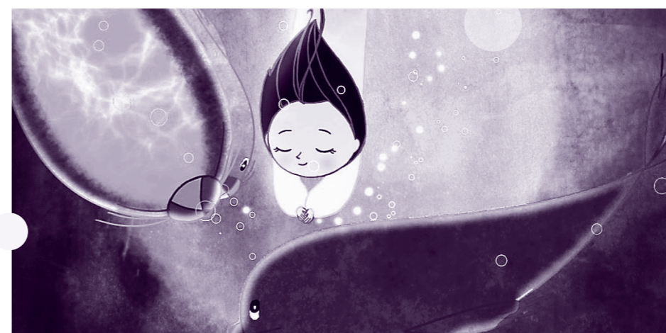
Píseň moře (režie: Tomm Moore)

Dnes jsou pro děti přichystány jak projekce v sále České televize, tak v kině Světozor. V 10.00 promítáme v kině celovečerní finsko-francouzské Muminky na Riviéře , poté můžete ve 12.30 vidět japonský Příběh o princezně Kaguje . Sál České televize ovládnou tradičně večerníčky – tentokrát výběry Máme rádi českou loutku a Voní to tu rybinou . Mezitím ale promítáme i poutavou celovečerní pohádku Píseň moře , která podobně jako filmy v kině Světozor spadá do mezinárodní soutěže. A na závěr dne pustíme v rámci sekce Pocta Vlastě Pospíšilové výběr Vlasta a kuťáci , čekají nás tedy oblíbení vynalézaví nešikovné Pat a Mat .