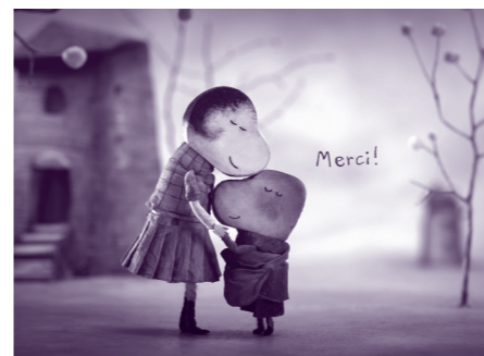
Filmy nominované na cenu Cartoon d'Or

Dnes startuje letošní půlnoční animace . Po tři večery vás od 23.30 v kině Světozor čekají filmy, které si ani nedovedete představit. Dnes speciální krátkometrážní výběr Pohled do útroh s tematikou rozkladu a vnitřnosti