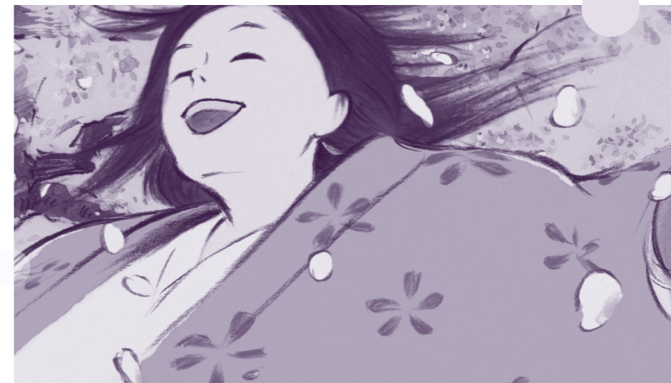
Příběh o princezně Kaguje (režie: Isao Takahata)