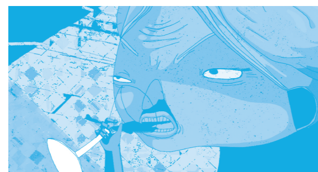
Temný kabát (Jack O'Shea, 2015)