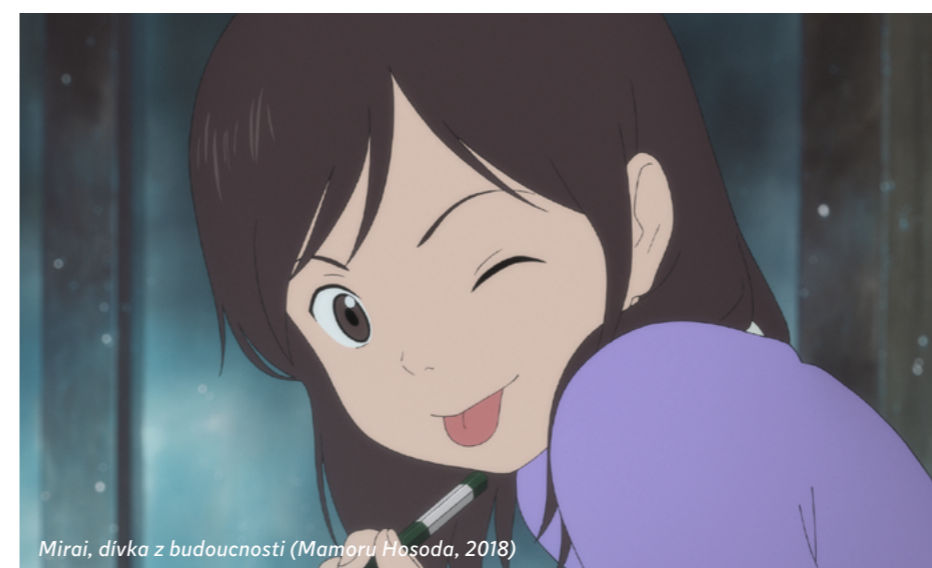
Mirai, dívka z budoucnosti (Mamoru Hosoda, 2018)

Dnes se můžete na vítězné filmy zajít podívat a hry si ozkoušet v Game & VR zóně v Měšťanské besedě.