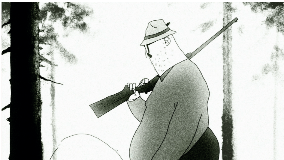
Happy End (Jan Saska, 2015)

Jednoduchá forma filmu Přepadení vycházela z vnějších podmínek, konkrétně nestíhání klauzur. Původně jsem měl vymyšlený úplně jiný námět, ale v průběhu prázdnin jsem před zářijovým termínem klauzur zjistil, že ho určitě odevzdat nestihnu a zbývaly mi dva týdny na to, abych vymyslel něco jiného na dané zadání, které mělo vycházet z nějakého přísloví. A když jsem přemýšlel,